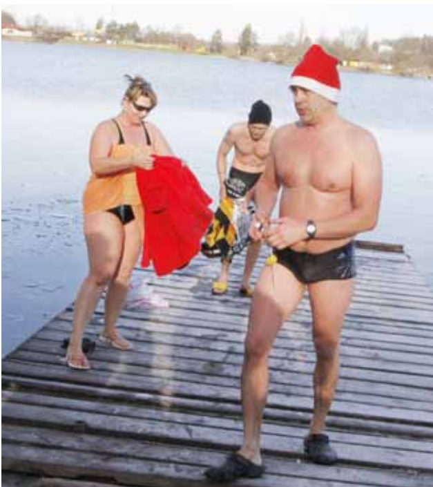
A teď rychle do tepla. Koupání bylo osvěžující, ale i otužilci se musejí rychle osušit a schovat do tepla.