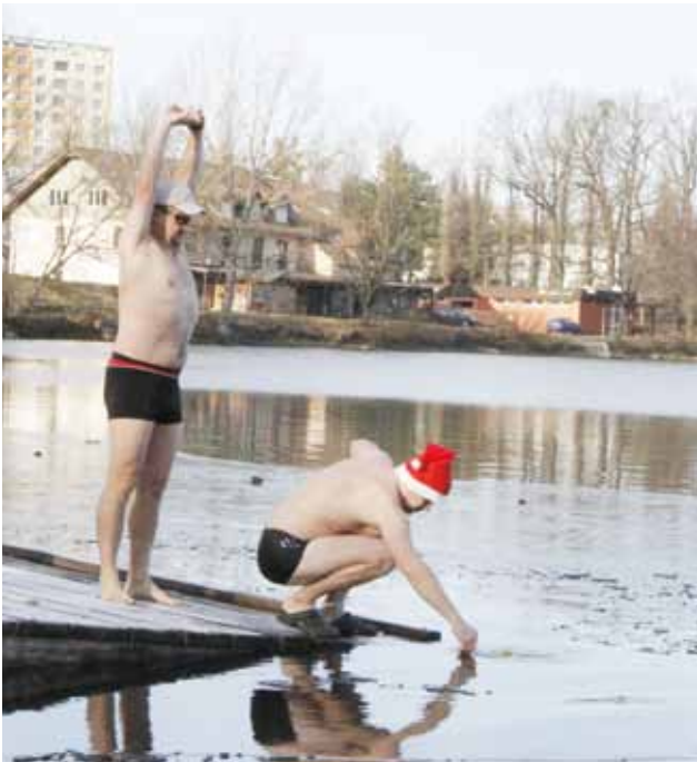
Tak jaká dneska je? Kvůli mrazu byl v okolí starého mola ledový škraloup, který museli otužilci rozbít. Teplota vody byla 3 °C.