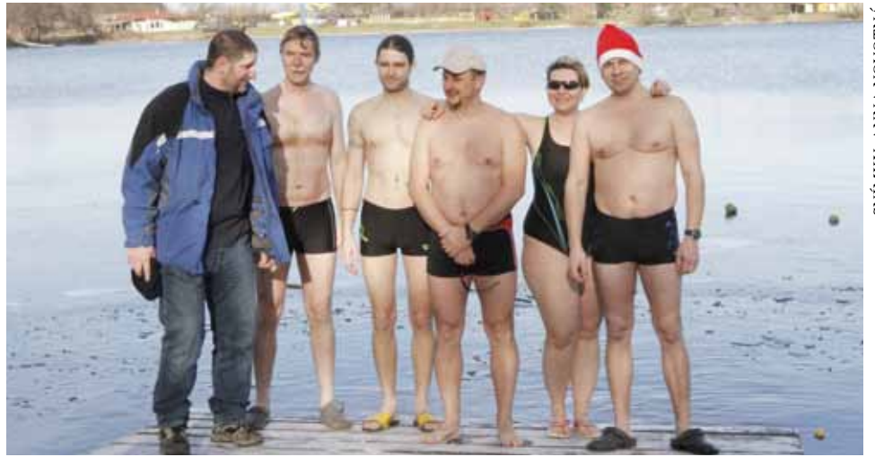
Kdopak by se mrazu bál. Sestava otrokovických otužilců pózovala při -3,5 °C. Pocitová teplota byla kvůli větru ještě nižší. Do vod Štěrковиště se 31. prosince vydala pětice odvážlivců.