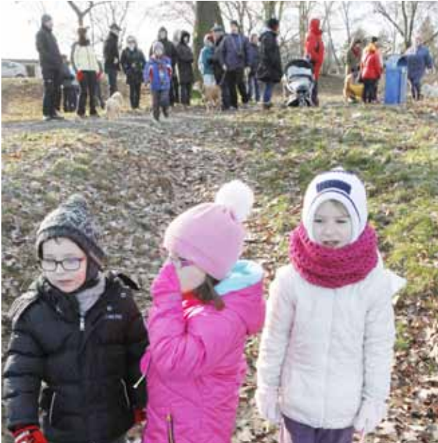
Diváci. Zachumlaným divákům, kteří obsypali břeh Štěrковиště, byla možná větší zima než otužilcům plavajícím ve vodě.