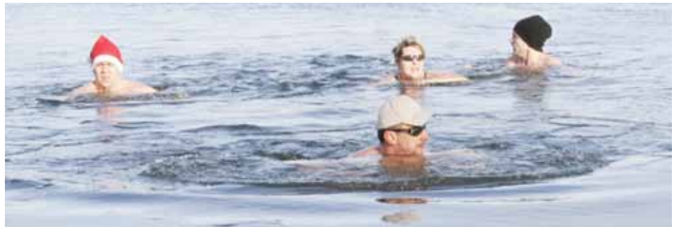
Chladná, ale příjemná. Otužilci si ve Štěrковиšti užili asi pět minut. Voda jim i díky chladu venku přišla příjemná. Pozor museli dávat na kry, které jsou velmi ostré.