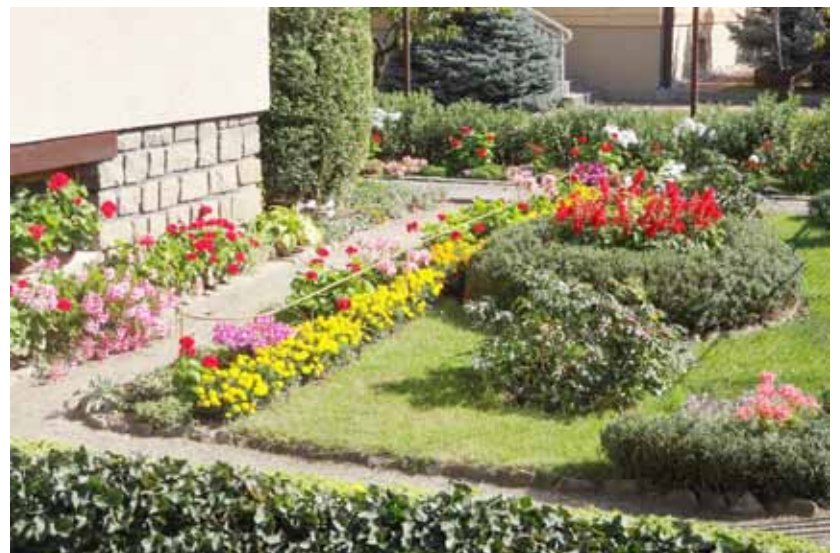
Květinová výzdoba a údržba zeleně u rodinných domů. 3. místo – Irena Pospíchalová v ulici B. Němcové za pečlivě upravenou zahrádku před domem.