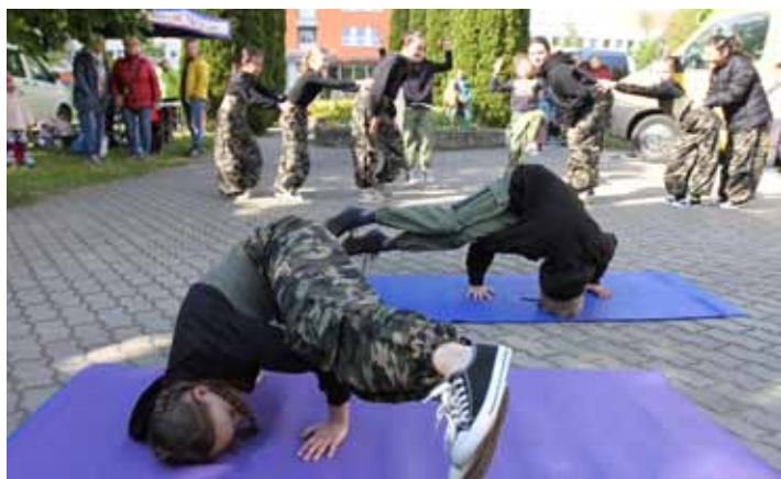
Malí tanečníci. Součástí zábavného odpoledne bylo také vystoupení tanečních kroužků DDM Sluníčko.