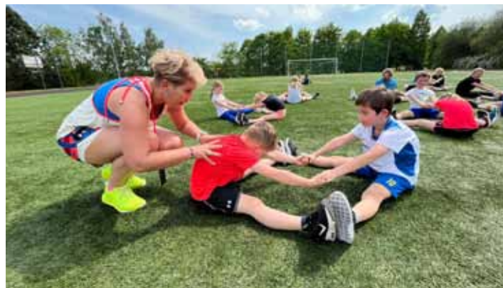
Trénink. Zuzana Hejnová založila HESU – sportovní akademii Zuzany Hejnové, která nabízí sportovní kroužky pro děti.