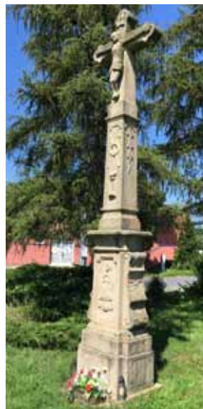
Předpokládané náklady: 50 tisíc korun

Kříž historicky stával na rozcestí Hložkovy ulice a ulice Na Uličce před Prokopovým stavením. V současnosti stojí v parčíku nedaleko původního místa. K původu této plastiky nejsou dostupné žádné bližší informace. Nicméně na tomto místě – důležitém rozcestí tzv. Mešních cest do Tečovic – je kříž zaznamenán již na mapě 1. vojenského mapování (1764). Není proto nutné pochybovat o datu 1823 uvedeném na kříži, kdy došlo pravděpodobně k jeho postavení. Při budování sídliště v 70. letech 20. století byl kříž demontován a odvezen na hřbitov na Salaš. Na dlouhou dobu o něm nebylo nic známo. Až v roce 2008 se jej podařilo objevit a následným jednáním s římskokatolickou církví a výměnou za nový kamenný kříž pro salašský hřbitov se městu v roce 2009 podařilo památku získat zpět.