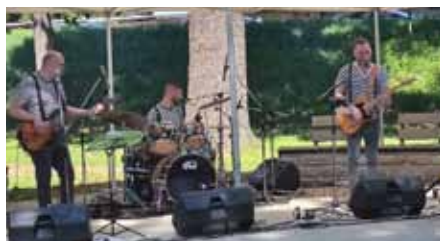
Pohoda v přístavišti. Program v přístavišti zpestřila kapela (shora) Erneston a Rock and Rollers.