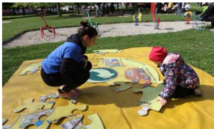
Zábava i poučení. V parku u polikliniky bylo pro děti připraveno několik stanovišť, kde se mohly naučit něco zajímavého, ale také se pobavit.