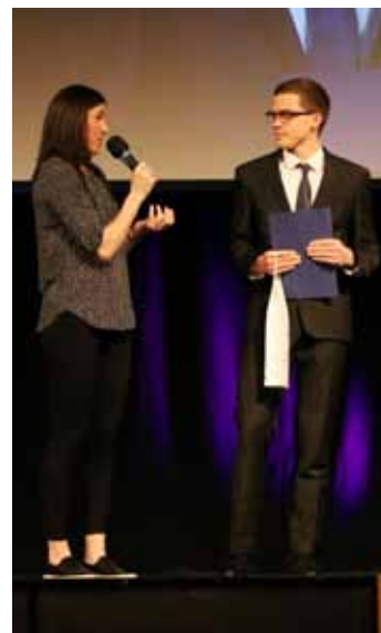
Sportovec města. Zuzana Hejnová byla letos hostem při předávání cen nejlepším sportovcům Otrokovic.

Myslím si, že v posledních letech dost zlenivěly. Negativně se na tom podepsal i covid, který na dlouhé roky děti zavřel doma. Takže teď je těžké dostat děti nejenom ke sportu, ale především je u něj udržet.