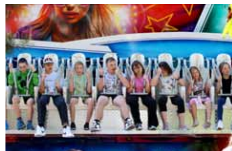
Pouť. Na pouti nechyběly oblíbené atrakce, které si užily celé rodiny.