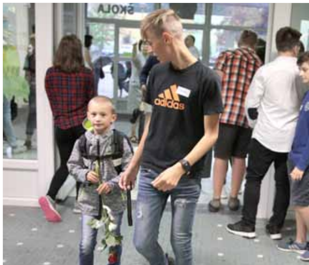
V doprovodu devátáka. Jedenapadesát prvňáčků Základní školy Trávníky doprovodili do tříd žáci z devátého ročníku.