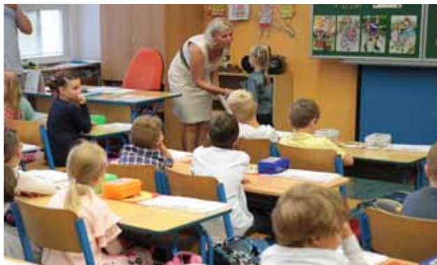
Naučím tě číst, psát i počítat... V Základní škole T. G. Masaryka přivítaly pedagožky šestačtyřicet nových žáků.

Sto sedmapadesát žáků nastoupilo 3. září do prvních tříd otrokovických základních škol. Stejně jako v uplynulých letech předstoupili před prvňáčky první školní den ředitelky, třídní učitelé a učitelky v doprovodu představitelů města, aby je přivítali v novém prostředí.