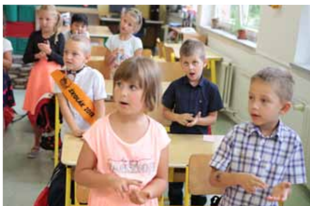
Začneme písničkou. Krásně sehaní byli hned první den prvňáčci v ZŠ Mánesova. V připomínce na počasí za okny si zazpívali písničku Prš, prš, jen se leje. Do školy nastoupilo šedesát dětí.