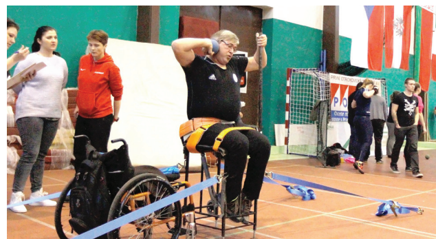
Exhibice vozíčkářů. Letos poprvé startovali handicapovaní sportovci, a to na exhibici ve vrhu koulí.

Skvělá atletická jména a vynikající výkony, tím se mohl pochlubit METAL-PS atletický mítink mládeže a dospělých Otrokovice 2016. Za české sportovce to byla účastnice letních olympijských her v roce 2012 v Londýně vícebojařka Eliška Klučinová. Ze zahraničních atletů sázeli pořadatelé například na Emel Dereli, tureckou mistryni ve vrhu koulí, která výkonem 18,09 metru překonala dosavadní rekord mítinku více než o metr a splnila kvalifikační limit pro letošní olympiádu v Brazílii. Rekord mítinku ve výšce mužů vylepšil Bělorus Andrei Churyla na výborných 228 centimetrů.