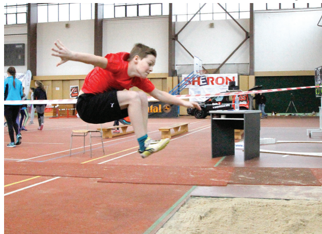
Mládí vpřed. Halových přeborů škol se zúčastnilo přes stovku mladých atletů.