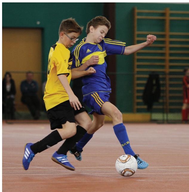
V zápalu boje. Mladí fotbalisté TVD Slavičín (žlutý dres) a SK Baťov 1930.